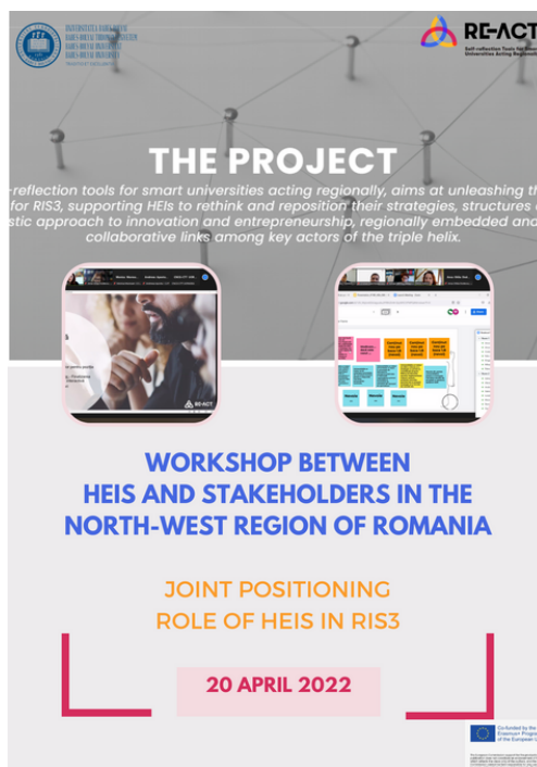
Workshop az UBB szervezésében 2022. április 20-án